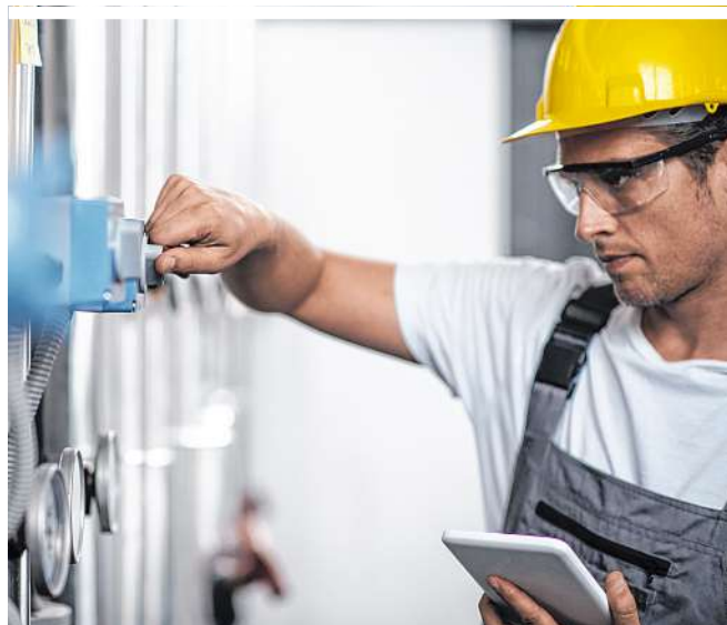
Rohrinstallateure sind bundesweit sehr gefragt