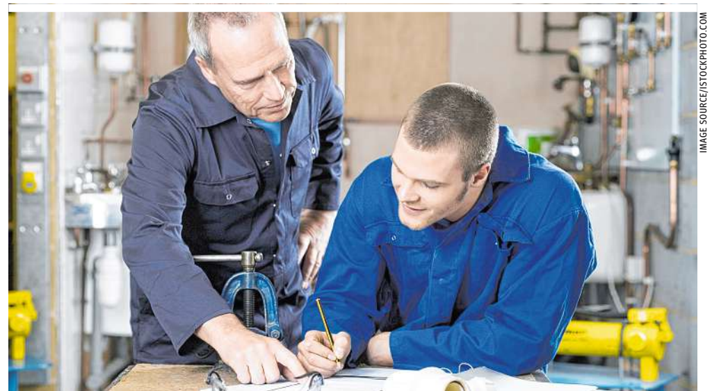
Durch Ausbildung in technischen Berufen dem Fachkräftemangel entgegenwirken