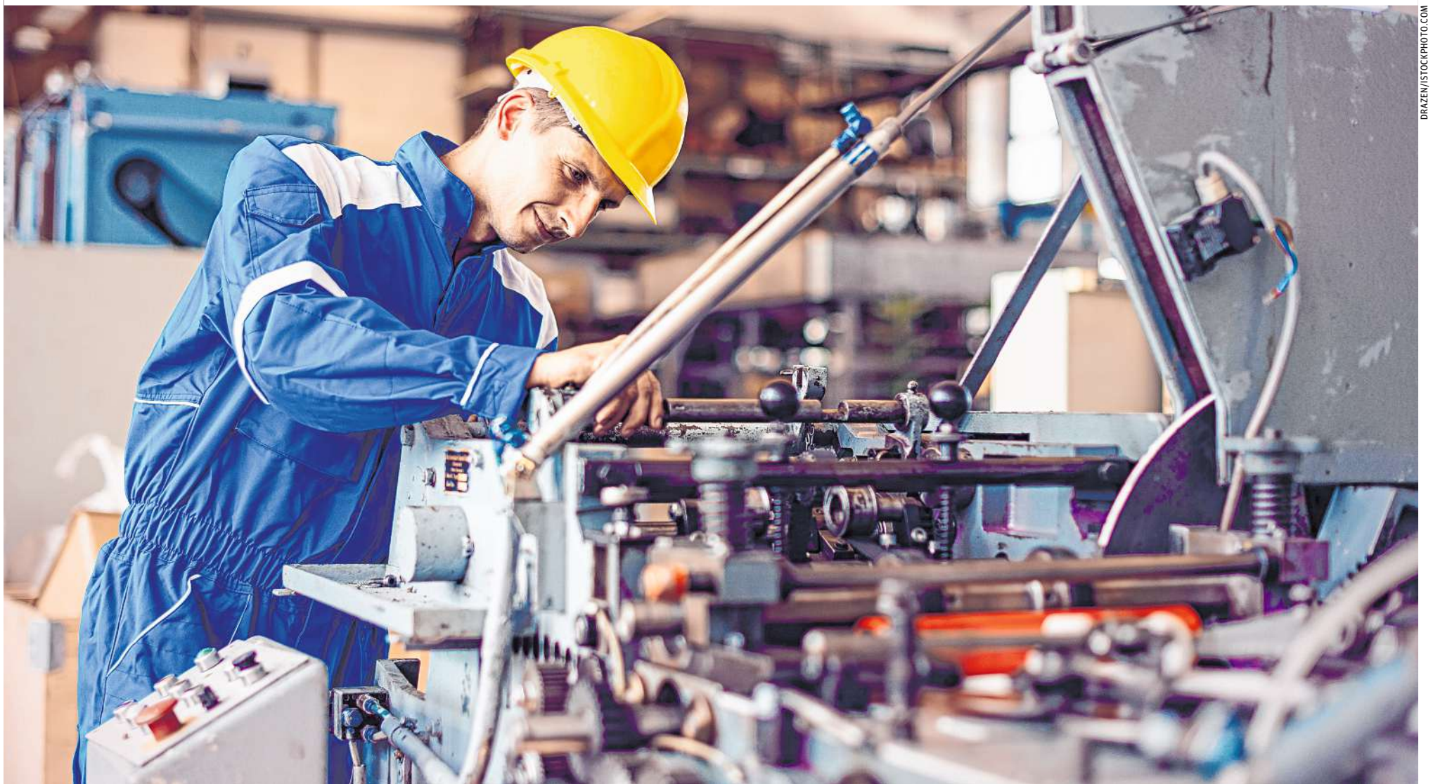
In fast allen Bereichen der österreichischen Wirtschaft fehlen Fachkräfte, besonders betroffen sind jedoch technische Berufe wie Dreher, Schweißer oder Maschinenbauer